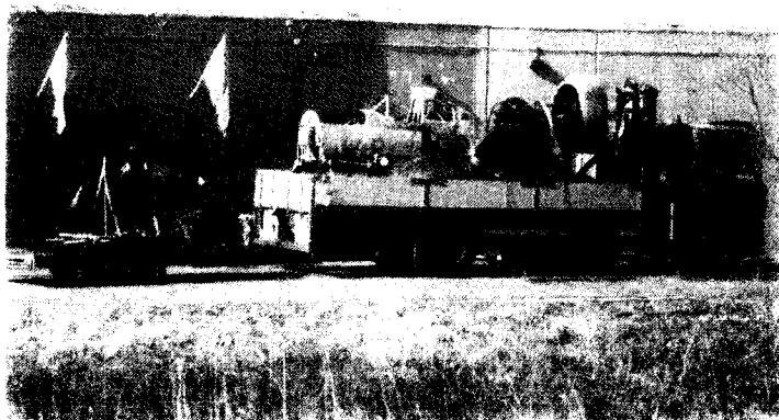
Het Fort bij Aalsmeer vult zich met luchtoorlog en verzet.

„Toen die mogelijkheid zich aandiende, hebben we die met beide handen aangegrepen. De eigenaar heeft de grond en loods in Lisserbroek enkele jaren geleden verkocht en we kunnen niet wachten op een museumpark. Daar wordt trouwens al tien, vijftien jaar over gepraat.”